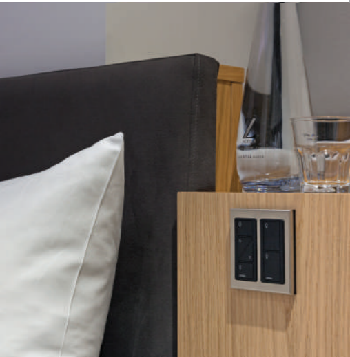
ピコ・ワイヤレス・コントロールを設計の中心に据え、ルートロンは2週間でZ Cityのモックアップルームに納品・設置することができました。