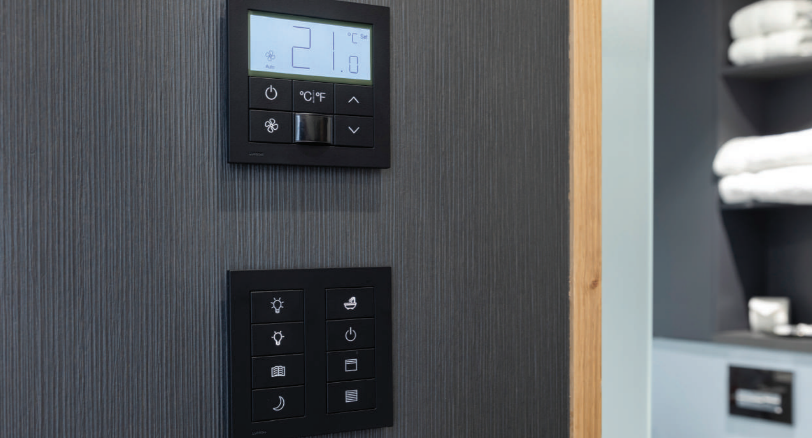
美しく便利なPalladiom（パラディウム）のサーモスタットとキーパッド