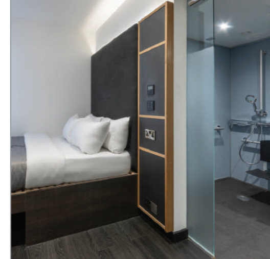
myRoomソリューションはゲストが直感的に操作でき、ホテルの他のシステムともシームレスに連携しています。

さらに、人感センサーでエネルギー節約、コスト削減にもつながるとKing氏は付け加えます。